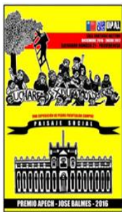
PEDRO FUENTALBA 2016