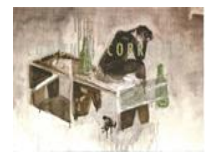
PREMIO APECH SEPTIMA VERSION 2013 FRANCISCO MORALES 2013