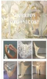
CONSTANZA ARANCIBIA 2008