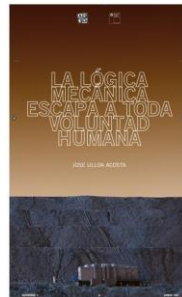
JOSE ULLOA 2019