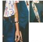
CRISTINA GONZALEZ 2012