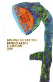
LAGUNA DE CARTON PREMIO APECH 4 VERSION 2010 GONZALO LAGUNA 2010