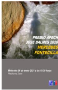
MERCEDES FONTECILLA 2020