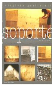
VIRGINIA GUILISASTI 2007