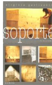
VIRGINIA GUILILASTI 2007