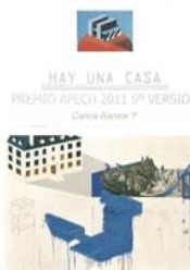
CARLOS RAMOS 2011