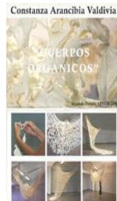
CONSTANZA ARANCIBIA 2008