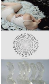
PAULA COÑOEPAN 2021