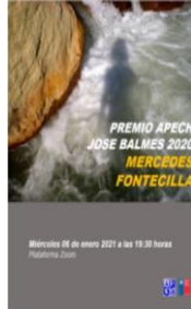
MERCEDES FONTECILLA 2020