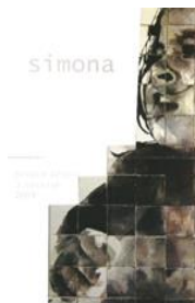
PAULINA ALTAMIRANO 2009