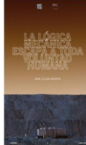
JOSE ULLOA 2019