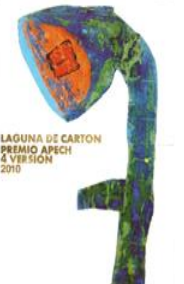
GONZALO LAGUNA 2010