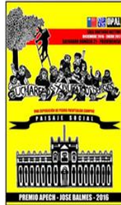
PEDRO FUENTALBA 2016